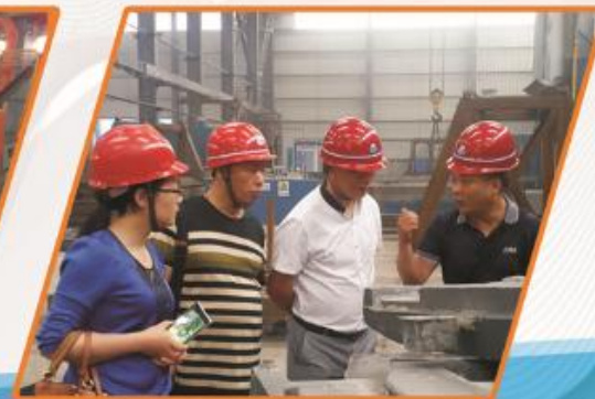
成都大宏立机器股份有限公司