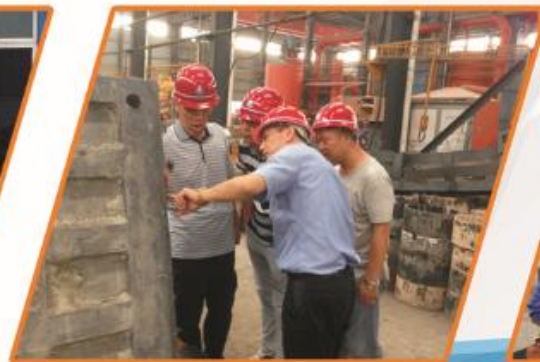
南通东方科技有限公司