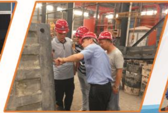
南通东方科技有限公司