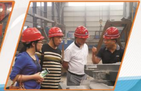
成都大宏立机器股份有限公司